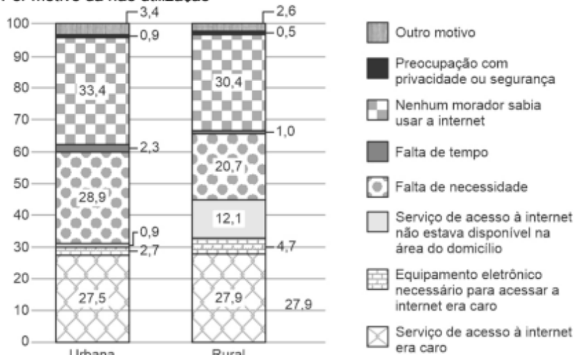
Distribuição dos domicílios em que não havia utilização da Internet (%) Por motivo da não utilização

(LOSCHI, Marília. Internet chega a 74,9 milhões de domicílios do país em 2024. Disponível em: < https://agenciadenoticias.ibge.gov.br/agencia-noticias/2012-agencia-de-noticias/noticias/44031-internet-chega-a-74-9-milhoes-de-domicilios-do-pais-em-2024 >. Publicado em: 24/07/2025. Acesso em: 30/04/2026)