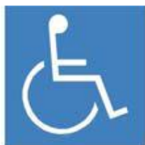
a) Branco sobre fundo azul

30. O símbolo internacional de acesso ilustrado na figura I deve indicar a acessibilidade aos serviços e identificar espaços, edificações, mobiliário e equipamentos urbanos onde existem elementos acessíveis ou utilizáveis por pessoas portadoras de deficiência ou com mobilidade reduzida, segundo a NBR 9050. Sobre sua aplicação, essa sinalização deve ser fixada em local visível ao público, sendo utilizadas principalmente nos seguintes locais, quando acessíveis. Identificar e marcar todas as CORRETAS.