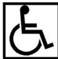
c) Preto sobre fundo branco