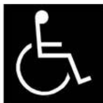
b) Branco sobre fundo preto