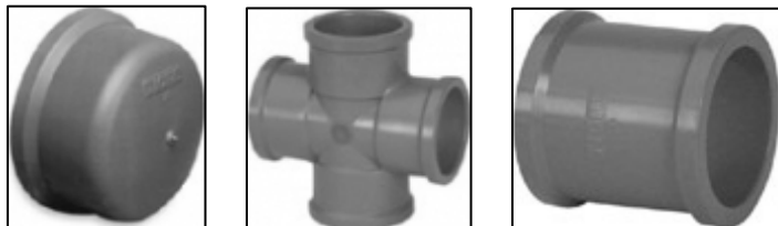
(I) (II) (III)

Assinale a alternativa que relaciona a seqüência correta das conexões, conforme figuras I, II e III utilizadas no sistema de abastecimento de água.