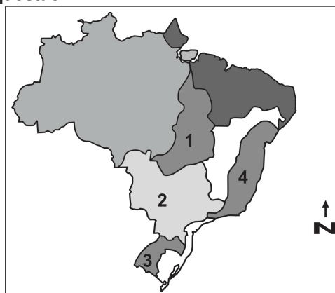
Mapa 2: Brasil - Principais bacias hidrográficas