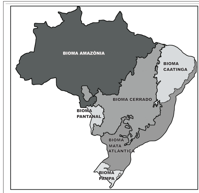
Mapa 1: Biomas brasileiros

(Disponível em: <www.ibge.com.br.> Acesso em: 10 jul. 2007.)