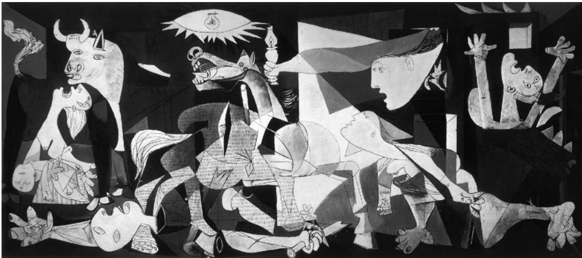
GUERNICA, 1937 Óleo em tela; 3,5x7,7 metros Museu Nacional Centro de Arte Rainha Sofía, Madri.

Nesse mesmo ano, motivado pela brutalidade dos acontecimentos, Pablo Picasso pintou o quadro “Guernica”, reproduzido a seguir.