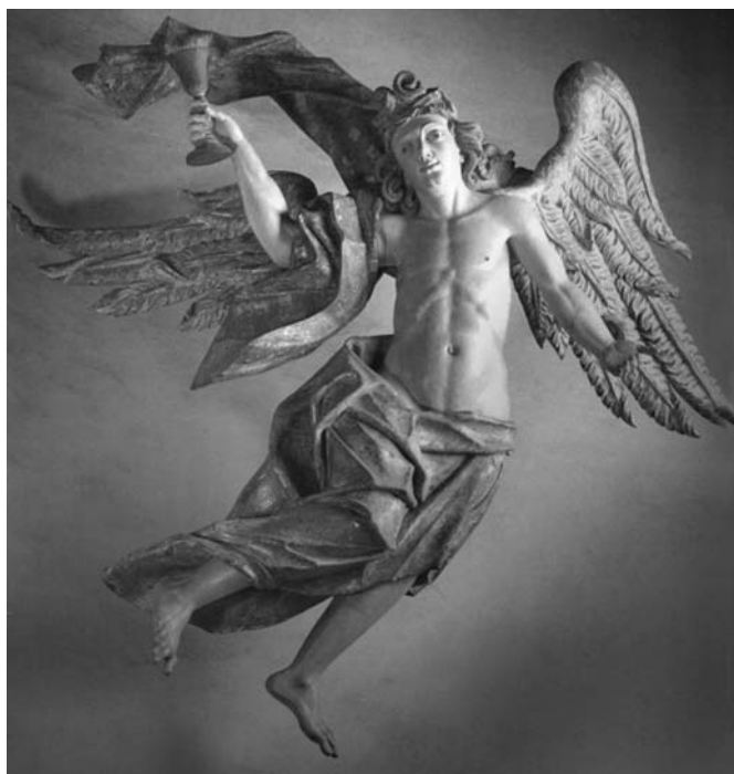
FIGURA DO ANJO , 1796-1799. Capela do Passo do Horto Santuário do Senhor Bom Jesus de Congonhas, MG.

Antônio Francisco Lisboa, também conhecido como o Aleijadinho, foi um dos artistas brasileiros mais importantes do Período Colonial. Dentre suas obras, destacam-se esculturas de Cristo, profetas, santos e anjos, espalhadas, principalmente, pelas igrejas de Minas Gerais.