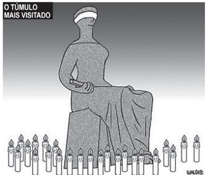
WALDEZ. O Liberal (PA). 03 nov. 09.

A charge jornalística não só ilustra uma notícia, mas também a interpreta, produzindo o humor.