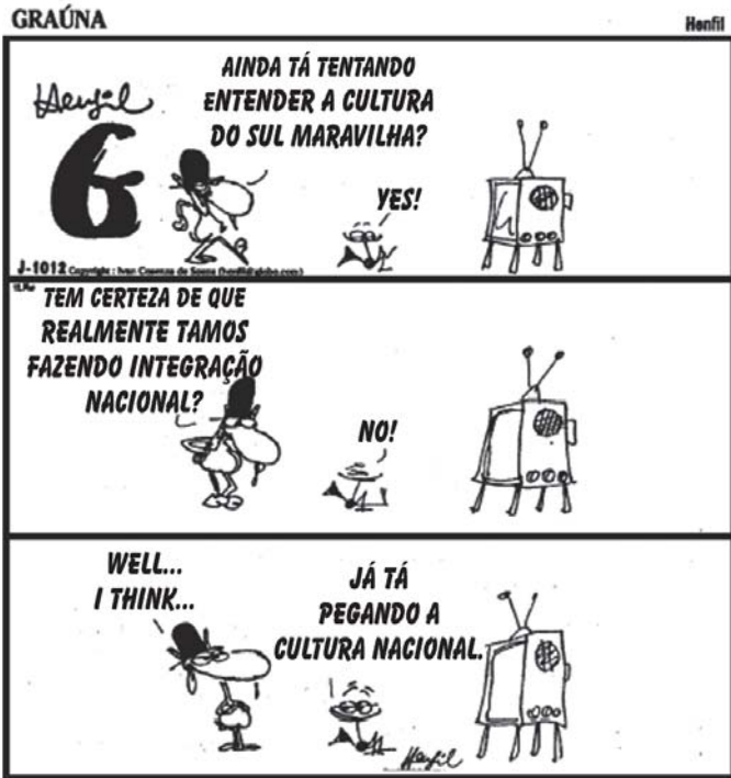
HENFIL. O Globo, maio 2005.

Na tira acima, observa-se um desvio no emprego da norma culta da Língua Portuguesa. Com base no entendimento da mensagem e considerando o último quadrinho, o uso de tal variação pode ser explicado pelo fato de