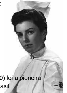
Anna Nery (1814-1880) foi a pioneira da enfermagem no Brasil.

A Escola de Enfermagem Anna Nery/EEAN da Universidade Federal do Rio de Janeiro/UFRJ, primeira Escola de Enfermagem no Brasil, surgiu no contexto do movimento sanitarista brasileiro do início do século XX. Em 90 anos de existência a instituição registra um papel histórico-social de vanguarda, na expansão e desenvolvimento da enfermagem em nosso País. Destacam-se nesse percurso, entre outras realizações, a criação da Associação Brasileira de Enfermeiras Diplomadas (1926), atualmente Associação Brasileira de Enfermagem – ABEn; a criação de novas escolas de enfermagem; a organização de hospitais e centros de saúde, formação e qualificação de enfermeiros Especialistas, Mestres, Doutores e em Programas de Pós-Doutorado, principalmente, em todas as regiões do país e na perspectiva de Cooperação Técnica e Científico-Cultural com alguns países da América Latina (Argentina, Colômbia, México, Peru) e da África (Angola e Moçambique).