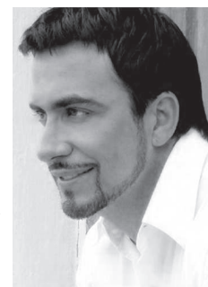
Fábio de Melo

O amor nos possibilita enxergar lugares do nosso coração que sozinhos jamais poderíamos enxergar.