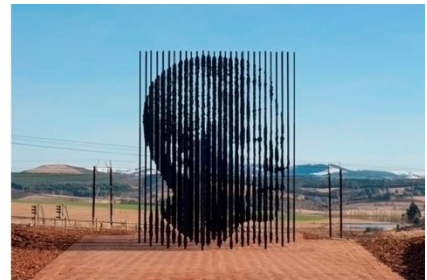
Marco Cianfanelli, Release (Soltura), 2012, África do Sul, aço pintado e cortado a laser, profundidade 20,8 m, altura 9,48 m e largura 5,19 m.

As imagens apresentam, de diversos ângulos, a escultura de Marco Cianfanelli em homenagem ao 50º aniversário da captura e prisão de Nelson Mandela, em 1962. A obra é composta por hastes de aço de altura variável, cortadas a laser e inseridas na paisagem, na província de KwaZulu-Natal, onde Mandela foi detido pelo regime do apartheid . Ao comentar a sua obra, o artista afirmou: "As 50 colunas representam os 50 anos que se passaram desde a sua captura, mas também sugerem a ideia de que muitos compõem um conjunto; referem-se à solidariedade. Indicam a ironia de que o encarceramento de Mandela o transformou em um ícone de luta, alimentando a resistência que levou o país à democracia".