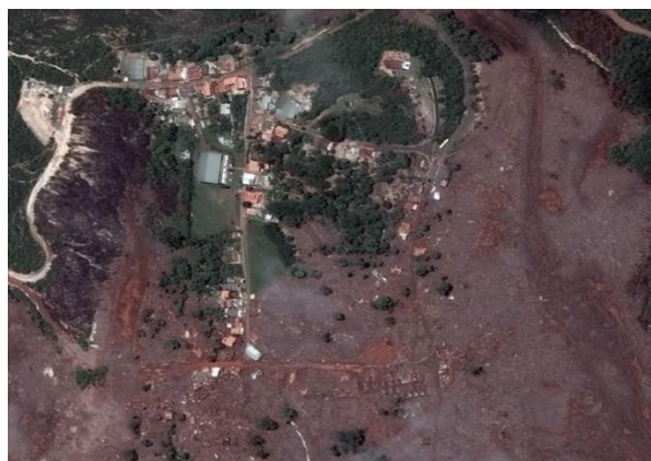
(foto aérea após o acidente)