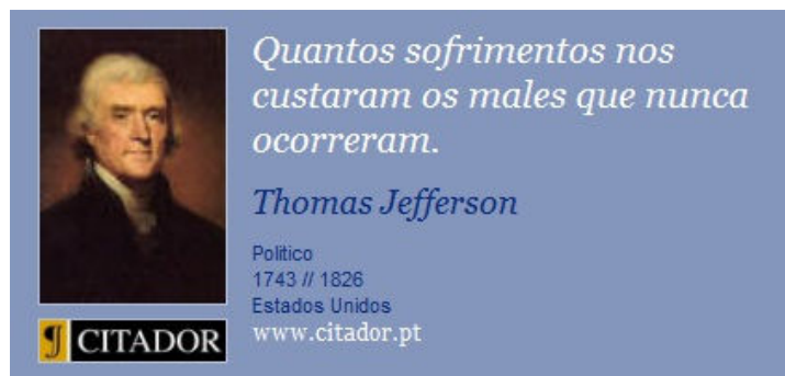
Imagem para as questões 01, 02 e 03:

01) A sentença acima nos remete a ideia de: