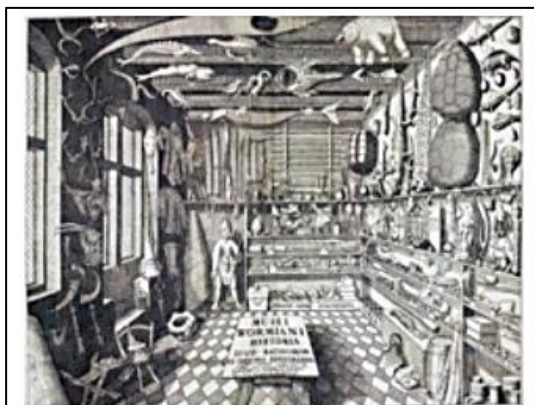
Figura 1 - Gabinete de Curiosidades.

A figura apresenta um local característico das exposições onde os colecionadores colocavam seus objetos trazidos de viagens em uma sala, formando os gabinetes de curiosidade (aproximadamente no século XV), às vezes organizando-os por cores ou temáticas sem finalidade expositiva e com visitação apenas por pessoas da elite. Na atualidade, para se organizar e proceder a montagem uma exposição de cunho museológico é necessário, entre outros fatores, respeitar uma sequência de passos.