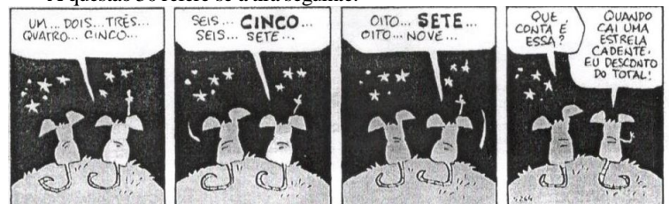
Fernando Gonsales. Cadê o ratinho do titio. São Paulo: Devir, 2011. p. 10.)

30 - A respeito da oração “Quando cai uma estrela cadente”, indique o tipo de relação que ela mantém com a outra oração.