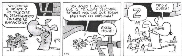
(Fernando Gonsales. Niquel Náusea — Cadê o ratinho do titio?. São Paulo: Devir, 2011. p. 33.)

26 - A função sintática do primeiro “QUE” do segundo quadrinho é de: