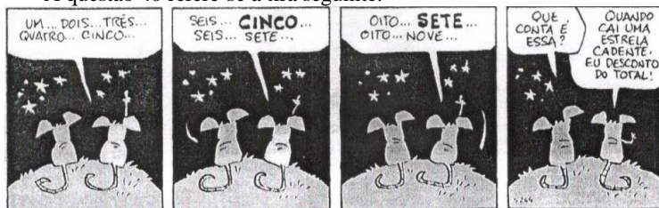
Fernando Gonsales. Cadê o ratinho do titio. São Paulo: Devir, 2011. p. 10.)

40 - A respeito da oração “Quando cai uma estrela cadente”, indique o tipo de relação que ela mantém com a outra oração.