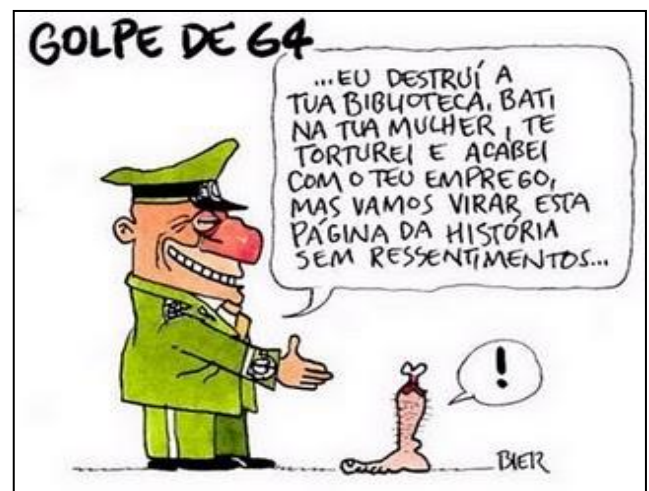
Revista Carta Capital de 28 de dezembro de 2011

(Adaptado da revista carta capital, Ed. Especial)