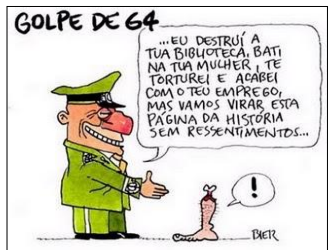
Revista Carta Capital de 28 de dezembro de 2011

(Adaptado da revista carta capital, Ed. Especial)