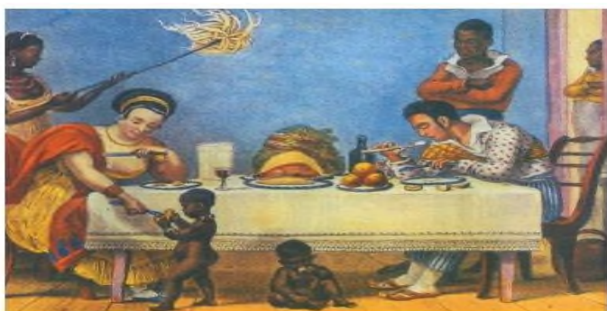
Obra de Jean-Baptiste Debret, que viveu no Brasil entre 1816 e 1831. O artista retratou a mulher, esposa e mãe no cotidiano da casa-grande ou dos assobradados das cidades coloniais.

28. Observe a figura abaixo e analise as afirmativas que seguem: