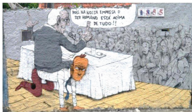
(ITO, Paulo. São Paulo, Vila Madalena, Março 2014.)

A imagem mostra o dirigente de uma companhia falando a seus colaboradores. O líder procura motivar os comandados ao afirmar que “o ser humano está acima de tudo”, é a preocupação central da empresa. Mas se o discurso é motivador, o gesto de sentar sobre um empregado é desalentador. Esse conflito entre o falar e o agir faz com que a cena seja: