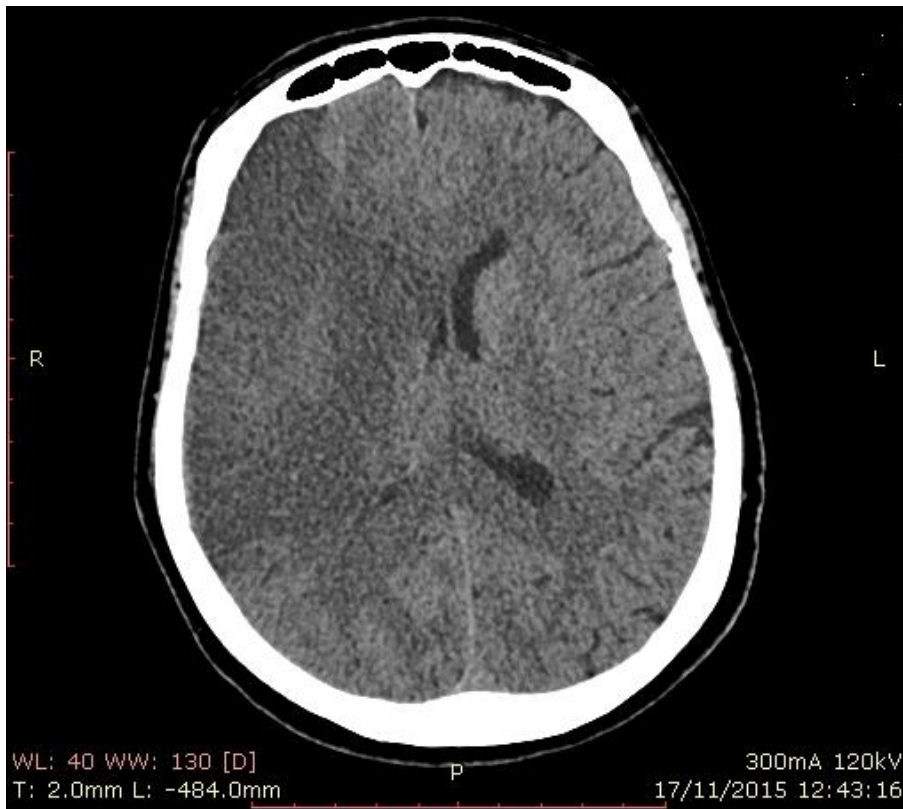
Figura 2 – TC 24 h após a admissão