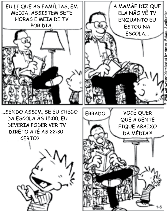
(Bill Watterson. O melhor de Calvin . http://cultura.estadao.com.br/quadrinhos . 05.01.2018)

Leia a tira para responder às questões de números 01 e 02.