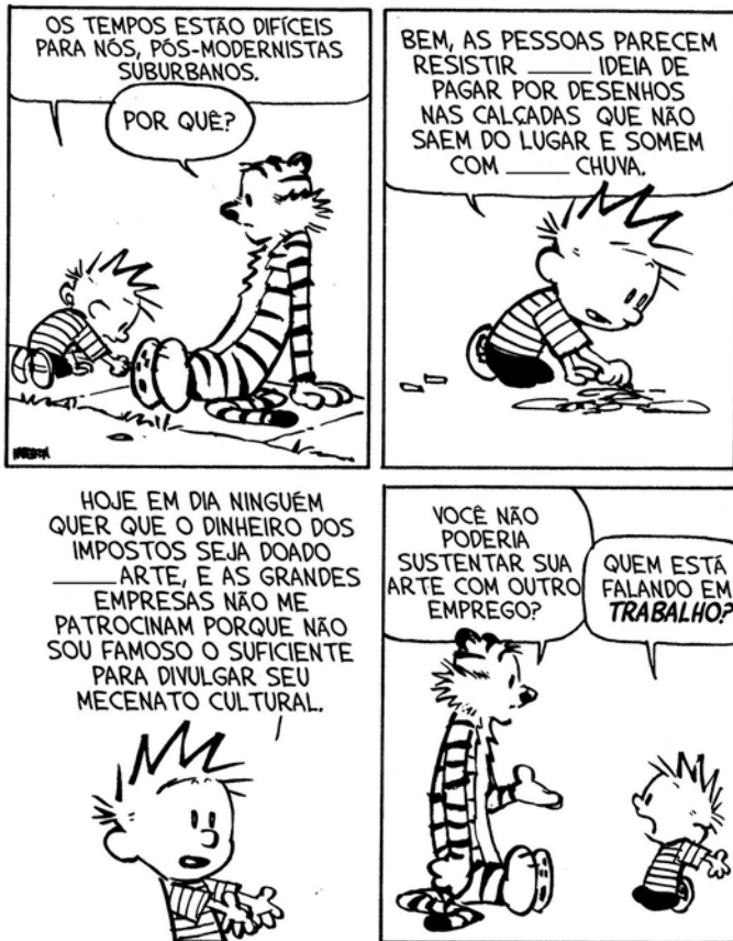
(Bill Watterson. O mundo é mágico: as aventuras de Calvin e Haroldo . São Paulo: Conrad Editora do Brasil, 2010. Adaptado)