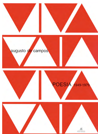
Capa do livro Viva Vaia de Augusto de Campos

50 Viva Vaia é um poema concreto publicado em 1972 e dedicado ao compositor Caetano Veloso, que havia sido vaiado por grande parte do público presente ao Teatro Tuca, no Festival Internacional da Canção de 1968. Desde então, em diversos momentos, o poema é utilizado com intuito de dar significação a episódios da cena política e cultural brasileira.