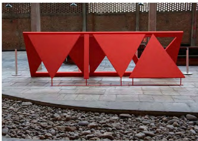
II - Escultura em aço feita sob a supervisão de A. de Campos, 2016

Com relação às dimensões da poesia concreta apresentadas nas figuras I e II, assinale V para a afirmação verdadeira e F para a falsa.