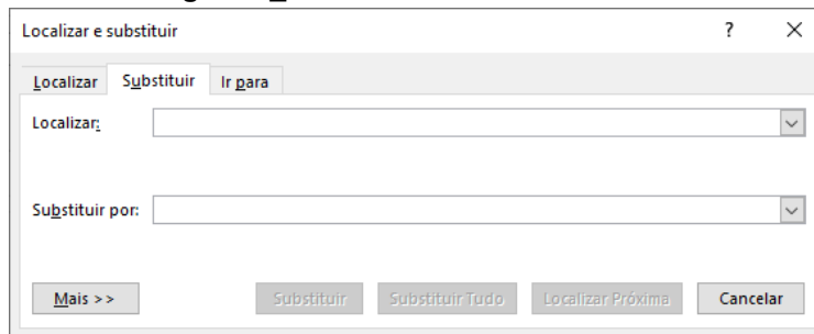
Figura 1_Janela Localizar e Substituir

No Word Professional Plus 2013, versão em português, o atalho que permite acessar a janela Localizar e Substituir é