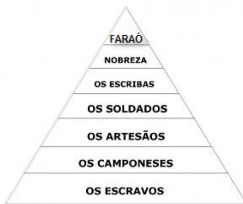
Gráfico da Pirâmide Social Egípcia

O antigo Egito era composto por classes de pessoas que iam desde o soberano Faraó até os escravos capturados em guerra. Vivia-se em uma Monarquia Teocrática. Se comparada com a maioria das culturas da época, a sociedade egípcia era mais liberal. Um homem que nascia em uma camada inferior, apesar de raro, poderia alcançar grandes postos em sua vida.