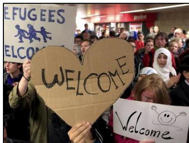
Grupo de refugiados é recebido com faixas de boas-vindas em estação ferroviária da Alemanha.

País abriu fronteiras para receber imigrantes de países em crise. Entre sábado e domingo, foram mais de 13 mil pessoas transportadas.