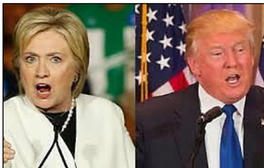
(Disponível em: http://www.emtempo.com.br/tags/donald-trump/ .)

“Após dois mandatos, Barack Obama não poderá concorrer a mais uma prolongação de sua estadia na Casa Branca em 2016. Acontecendo tradicionalmente na primeira terça-feira de novembro, as eleições presidenciais americanas têm sido, desde 1856, dominadas por dois grandes partidos. Segundo o think-thank apartidário PEW Research Center, a população americana vive uma onda crescente de partidarização. O mesmo pode ser dito nas outras esferas federais da política: tanto a Câmara do Senado quanto a dos Representantes, que compõem o Congresso americano, vivem um momento de polarização como não visto desde o final do século XIX.”