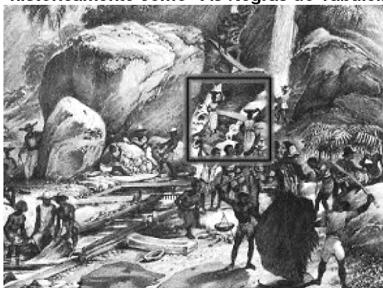
(Fonte: Lavagem do Minério do Ouro, perto do morro do Itacolomi, RUGENDAS, J. M., 1835)

23) O quadro em destaque na imagem abaixo representa uma cena do que conhecemos historicamente como “As Negras do Tabuleiro”.