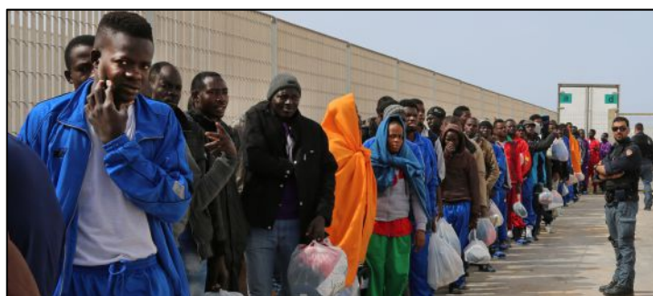
(Grupo de imigrantes em Lampedusa.)

Na conjuntura mundial atual, as manchetes jornalísticas e a imagem retratam