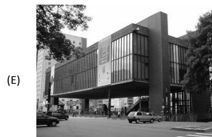
Museu de Arte de São Paulo (MASP).