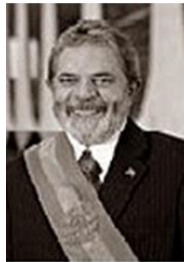
Luiz Inácio "Lula" da Silva