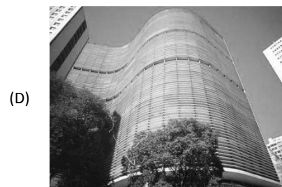
Edifício COPLAN, na cidade de São Paulo.