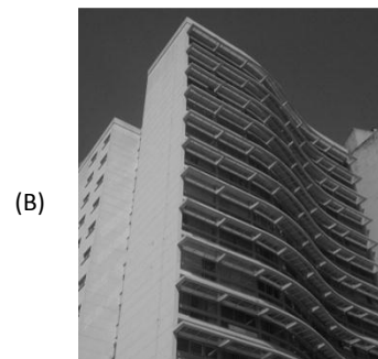
Edifício Itatiaia, Campinas.