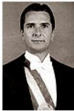
Fernando Collor de Melo