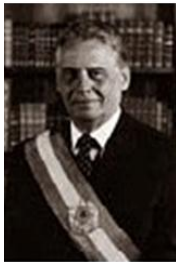
Fernando Henrique Cardoso