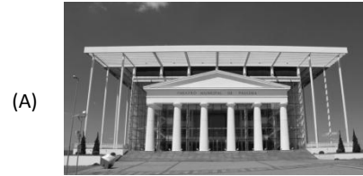
Teatro Municipal de Paulínia.

Assinale a opção que apresenta o edifício projetado por Paulo Mendes da Rocha.