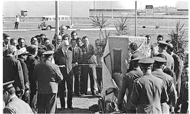
(Cerimônia de inauguração da REPLAN, em 12 de maio de 1972, com a presença do Presidente Médici e do então Presidente da Petrobrás, Ernesto Geisel.)

A construção da Refinaria do Planalto Paulista (REPLAN), em Paulínia, consagrou a cidade como polo petroquímico e teve fortes impactos políticos e socioeconômicos sobre o município. Assinale a alternativa que caracteriza corretamente um desses impactos.