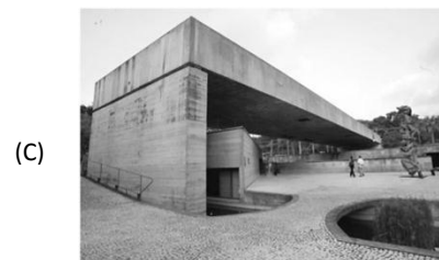
Museu Brasileiro da Escultura (MUBE), São Paulo.