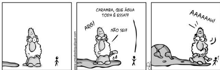
Fonte: Carlos Ruas – Um Sábado Qualquer ( http://www.umsabadoqualquer.com/ )

A tirinha de Carlos Ruas ( http://www.umsabadoqualquer.com/ ) apresenta um dos grandes problemas ambientais da atualidade, muito discutido internacionalmente, inclusive discutido em um tratado internacional importantíssimo, que visa a sua melhora. Assim, com base na tirinha apresentada e no que foi dito, assinale a alternativa CORRETA.