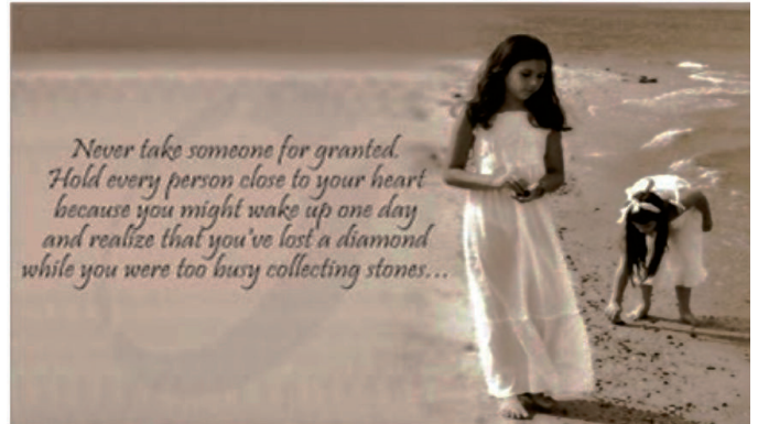
(From http://dictionaryquotes.blogspot.com.br/2013/08/famous-quotes-about-life.html )