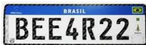
Figura 2

QUESTÃO 40 – Recentemente no Brasil, o layout das placas utilizadas nas motocicletas e nos demais veículos motores foi alterado para o modelo apresentado pela Figura 2 abaixo: