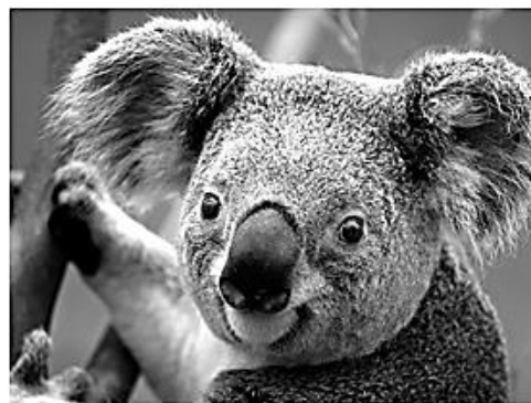
Figura 2 COALA