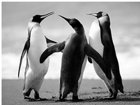
Figura 1 PINGUINS

38. Uma estudante de biologia está confeccionando um artigo científico no Word 2010, em sua configuração padrão. Uma das exigências da revista para publicar o artigo é que todas as imagens estejam numeradas e com nome. Para automatizar este trabalho, a estudante optou por utilizar o recurso “Inserir Legenda”, que além de numerar automaticamente a figura também é possível dar nome a ela. Assinale a alternativa que corresponda ao local para acessar esta ferramenta.