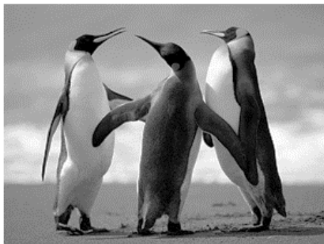
Figura 1 PINGUINS

38. Uma estudante de biologia está confeccionando um artigo científico no Word 2010, em sua configuração padrão. Uma das exigências da revista para publicar o artigo é que todas as imagens estejam numeradas e com nome. Para automatizar este trabalho, a estudante optou por utilizar o recurso “Inserir Legenda”, que além de numerar automaticamente a figura também é possível dar nome a ela. Assinale a alternativa que corresponda ao local para acessar esta ferramenta.