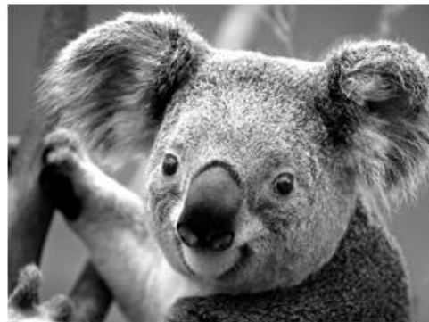
Figura 2 COALA