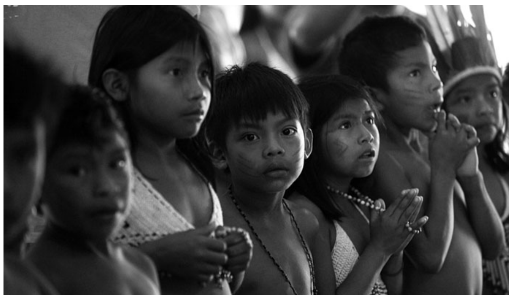
Crianças da Aldeia Raposa Serra do Sol.

CESARINO, Pedro. Histórias indígenas dos tempos antigos . São Paulo: Claro Enigma, 2015, p. 11-12. [Adaptado].