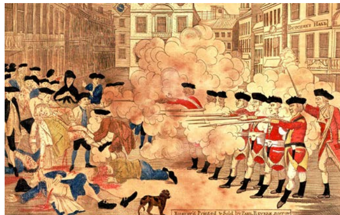
Gravura de Paul Revere (1770).

34) Segundo KARNAL, com a Lei do Selo, a coroa havia incomodado a elite das colônias. A reação foi grande assustando os agentes do tesouro na Inglaterra. Houve um movimento de boicote ao comércio inglês; no verão de 1765, decaiu o comércio com a Inglaterra em 600 mil libras. A figura abaixo se relaciona a qual acontecimento relacionado à Revolução Americana?