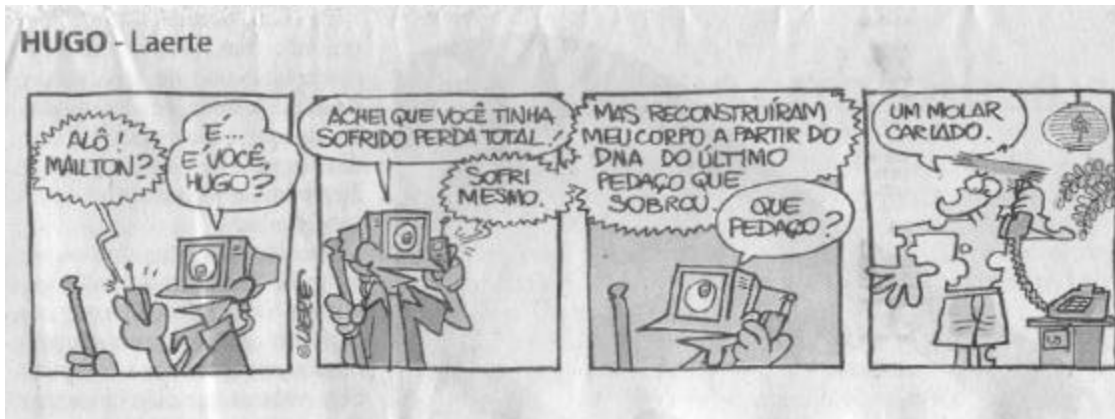
Folha de S. Paulo, 8/10/2003, p. F8.

3. Jogos de imagens e palavras são característicos da linguagem de história em quadrinhos. Alguns desses jogos podem remeter a domínios específicos da linguagem a que temos acesso em nosso cotidiano, tais como a linguagem dos médicos, a linguagem dos economistas, a linguagem dos locutores de futebol, a linguagem dos surfistas, dentre outras. É o que ocorre na tira de Laerte, acima apresentada.