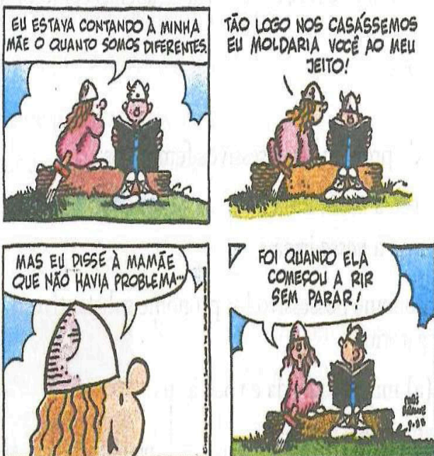
Dik Browne. Hagar. In Folha de S.Paulo, 14/9/1997. Intercontinental

11. Sobre o uso acento grave nos quadrinhos acima é correto afirmar que: