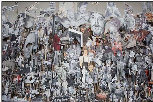
(Geoffrey Farmer. Leaves of Grass , 2012.)

Milhares de fotografias recortadas semanalmente durante cinco anos da revista Life (1935-1985) formam a escultura Leaves of Grass , do artista canadense Geoffrey Farmer . A obra foi exposta no 13 a Documento Art Festival , que apresenta obras de 200 artistas e acontece a cada cinco anos, na cidade de Kassel , na Alemanha. Trata-se de uma obra, de Geoffrey Farmer ,