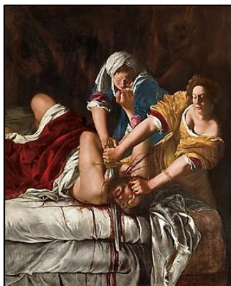
(Judite degolando Holofernes (1620), óleo sobre tela, 1,99 m x 1,62 m. Galeria Uffizi, Florença, Itália.)

No quadro anterior a artista retrata Judite degolando Holofernes , uma perturbadora e surpreendente descrição de uma história bíblica, que atraiu e fascinou artistas ao longo do século. Esta obra que apresenta uma dinâmica composição, cores claras e impressionante contraste de luz e escuridão, de estilo Barroco, foi pintada pela maior artista feminina do século XVII. Trata-se da artista italiana: