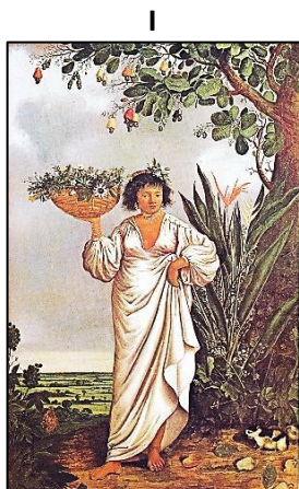
(Albert van der Eckhout, Mameluca , 1641. Óleo sobre tela, 267 cm x 16 cm. Museu Nacional da Dinamarca.)