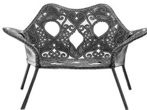
Obra dos Irmãos Campana