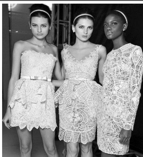
Modelos com vestidos de estilista Marta Medeiros