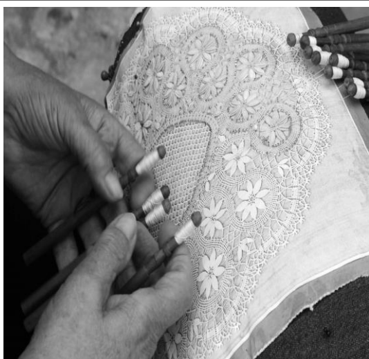
Renda de bilro

https://casaclaudia.abril.com.br/ambientes/conheca-as-pecas-assinadas-pelos-campana-em-parceria-com-espedito-seleiro/