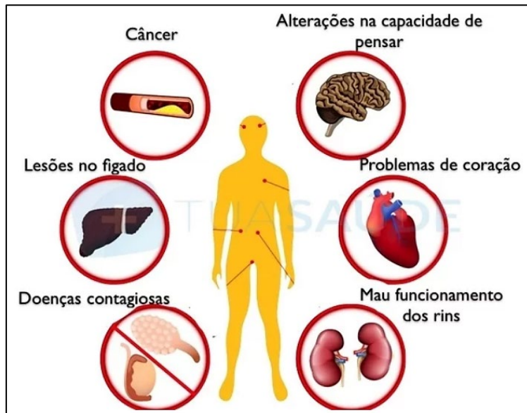
Lesões provocadas pelo consumo de drogas

(Disponível em: https://www.tuasaude.com/efeitos-das-drogas/ . Acesso em: janeiro de 2020.)