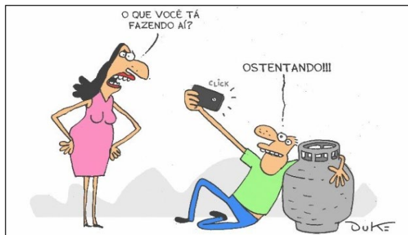
(Charge do Duke; via O Tempo. Disponível em: https://josiasdesouza.blogosfera.uol.com.br/2017/12/13/ostentacao/ )

Estabelecendo um paralelo entre a charge anterior e o texto em análise, pode-se afirmar que a charge: