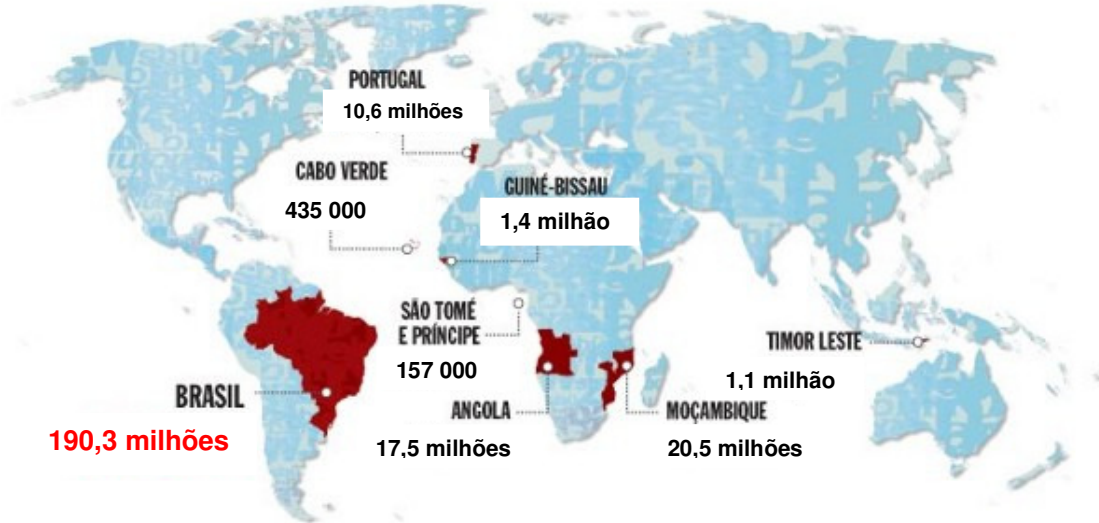
Ilustração: Revista VEJA

Como estão distribuídos os cerca de 240 milhões de cidadãos lusófonos abarcados pelo novo acordo ortográfico