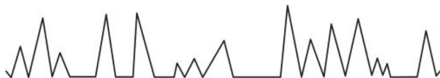
Figura 7

32. Observe a imagem espirométrica, abaixo, e assinale a alternativa que descreve, corretamente, o tipo de respiração: