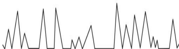
Figura 7

QUESTÃO N.º 35. Observe o traçado espirométrico, abaixo, e assinale a alternativa que indique, corretamente, o ritmo patológico indicado: