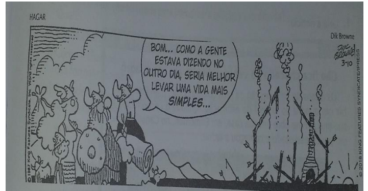
(BROWNE, Dik. O melhor de Hagar, o horrível 8. Porto Alegre L & PM, 2018 p. 70)

12- A expressão dos personagens da tirinha pode ser definida pelo sentimento de: