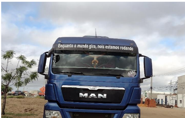
Caminhão estacionado em cidade pernambucana.