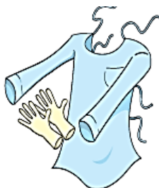
Luvas e Avental