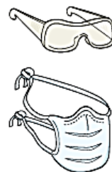
Óculos e Máscara