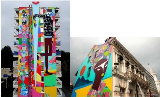
Mural em Amsterdam (2014). "Preta do Sul", Curitiba (2017).

A Figura I retrata a lateral de um prédio de um conjunto habitacional na periferia de Amsterdam, onde moram imigrantes provenientes das colônias holandesas, na qual o artista pintou um totem gigante de cabeças sobrepostas que lembram afrodescendentes, com seus turbantes e tatuagens coloridas. Ao lado do totem, pintou a figura de um dançarino negro.