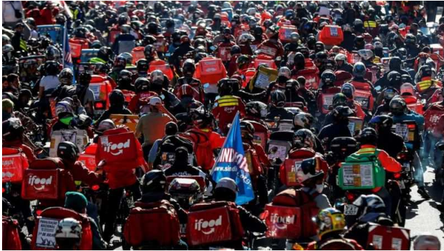
Entregadores realizam marcha em São Paulo (01/07/2020).

Durante a pandemia, a mobilização dos entregadores de aplicativos levantou um debate sobre suas condições de trabalho em uma economia cada vez mais “uberizada”.