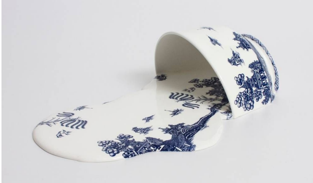
Livia Marin, Nomand Patterns , Impressão e esmalte em cerâmica e resina (2012).

A escultora chilena Livia Marin, na série Nomand Patterns (Padrões Nômades), criou um conjunto de peças a partir de fragmentos de xícaras e pratos que lembram a cerâmica inglesa vitoriana azul e branca, de inspiração chinesa. A obra retoma as cerâmicas em azul e branco do século XIX, quando eram sinal de prestígio e estavam associadas às classes aristocráticas, e mostra como em nossos dias elas foram massificadas por uma produção em larga escala.